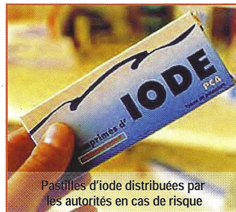
Pastilles d'iode distribuées par les autorités en cas de risque

Les autorités pourraient alors être amenées à prendre des contre mesures sanitaires notamment par le déclenchement du plan départemental de distribution des pastilles d'iode .