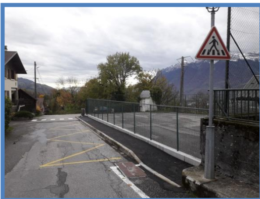
Création d'un cheminement piéton le long de l'école