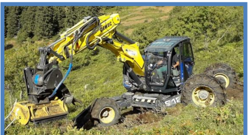
Travaux d'aménagement et d'entretien de l'alpage du Séchon