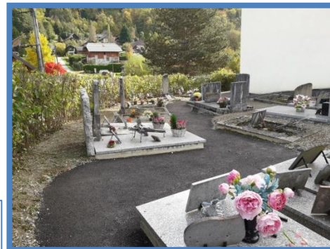
Aménagement P.M.R. (Personne à Mobilité Réduite) des allées du cimetière