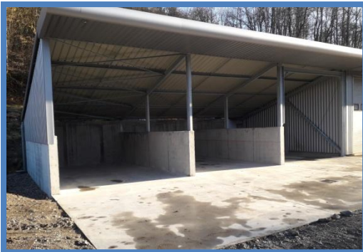
2 ème phase de la construction d'un local technique de stockage