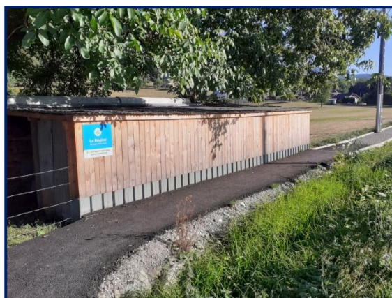
Création d'un cheminement piéton sur la R.D. 925 entre la Route des Moisseaux et le Chemin des Communaux