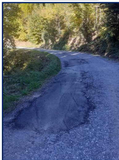
Entretien du partie de la route forestière de Grignon