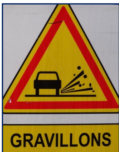
Entretien des voiries communales