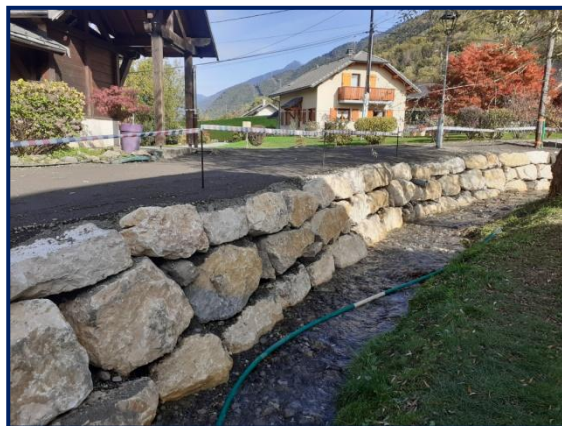
Enrochement du ruisseau du Paret