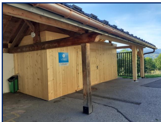
Rénovation du local technique et des sanitaires de l'École