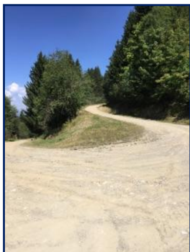
Entretien des pistes forestières