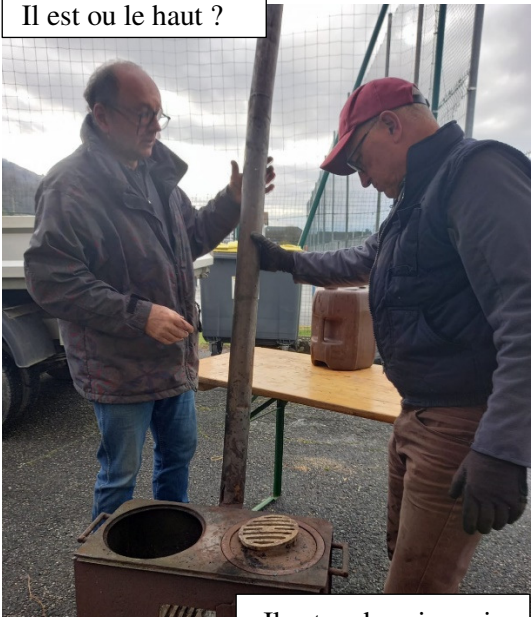
Il est ou le haut ?